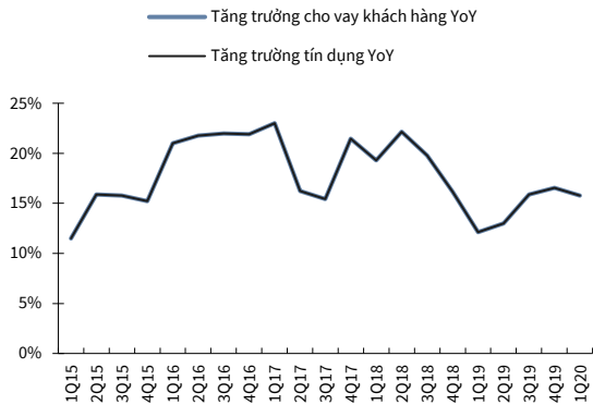
Bảng 1. ACB - Tăng trưởng tín dụng qua từng quý (QoQ) và qua từng năm (YoY), 1Q15-1Q20 (%)